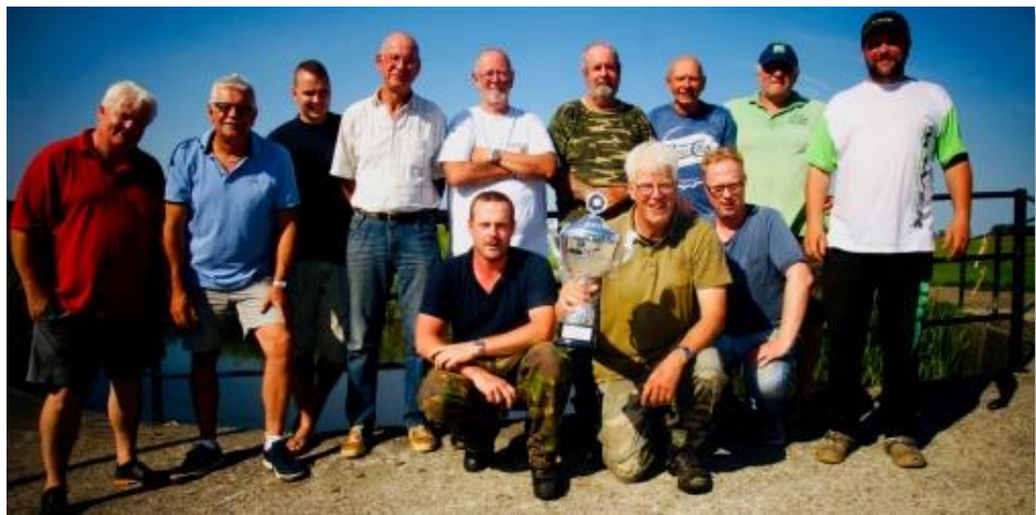
Het kampioensteam van NoordWest Fryslan met de Fryslân Cup.