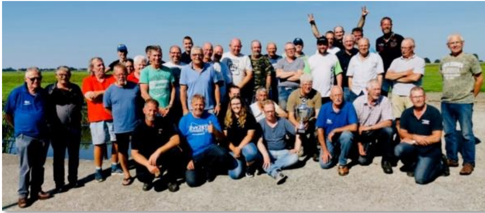
Alle deelnemers na afloop bij Slachtehiem