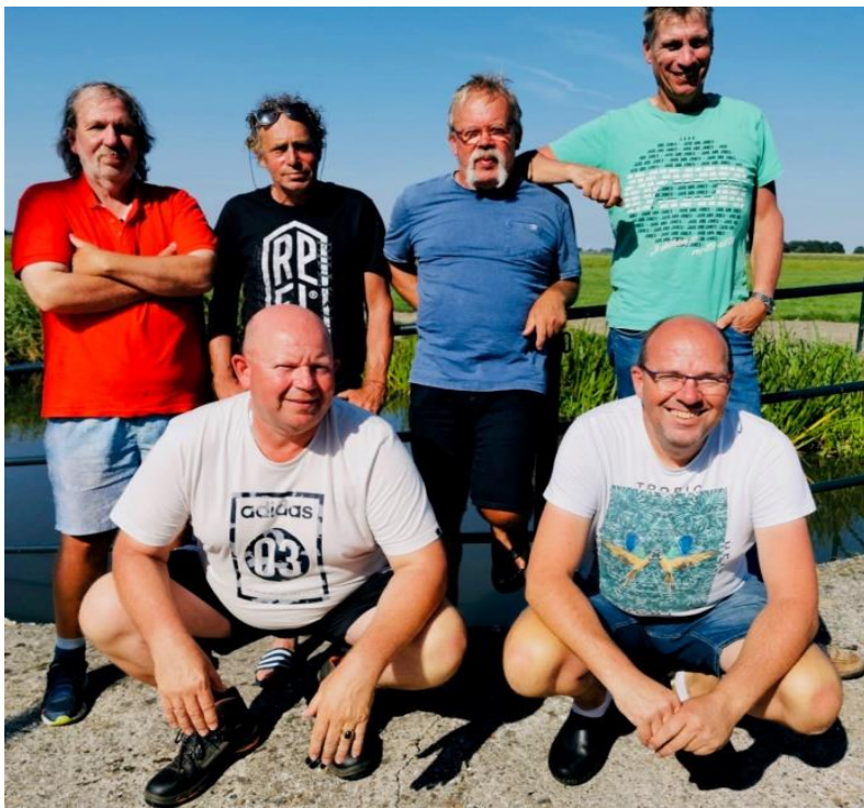
Het team van HSV de Bears, Balk September