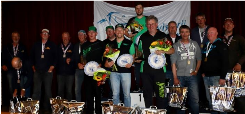
Op de foto ziet u de winnaars 1 tm 3: links de Grondel 1, midden Fries Kampioen Sensas 18, rechts Westergeest.

In totaal wisten de 65 deelnemers bijna 143 kg vis te vangen.