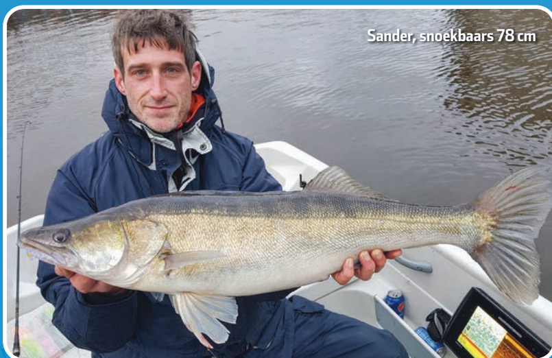
Sander, snoekbaars 78 cm