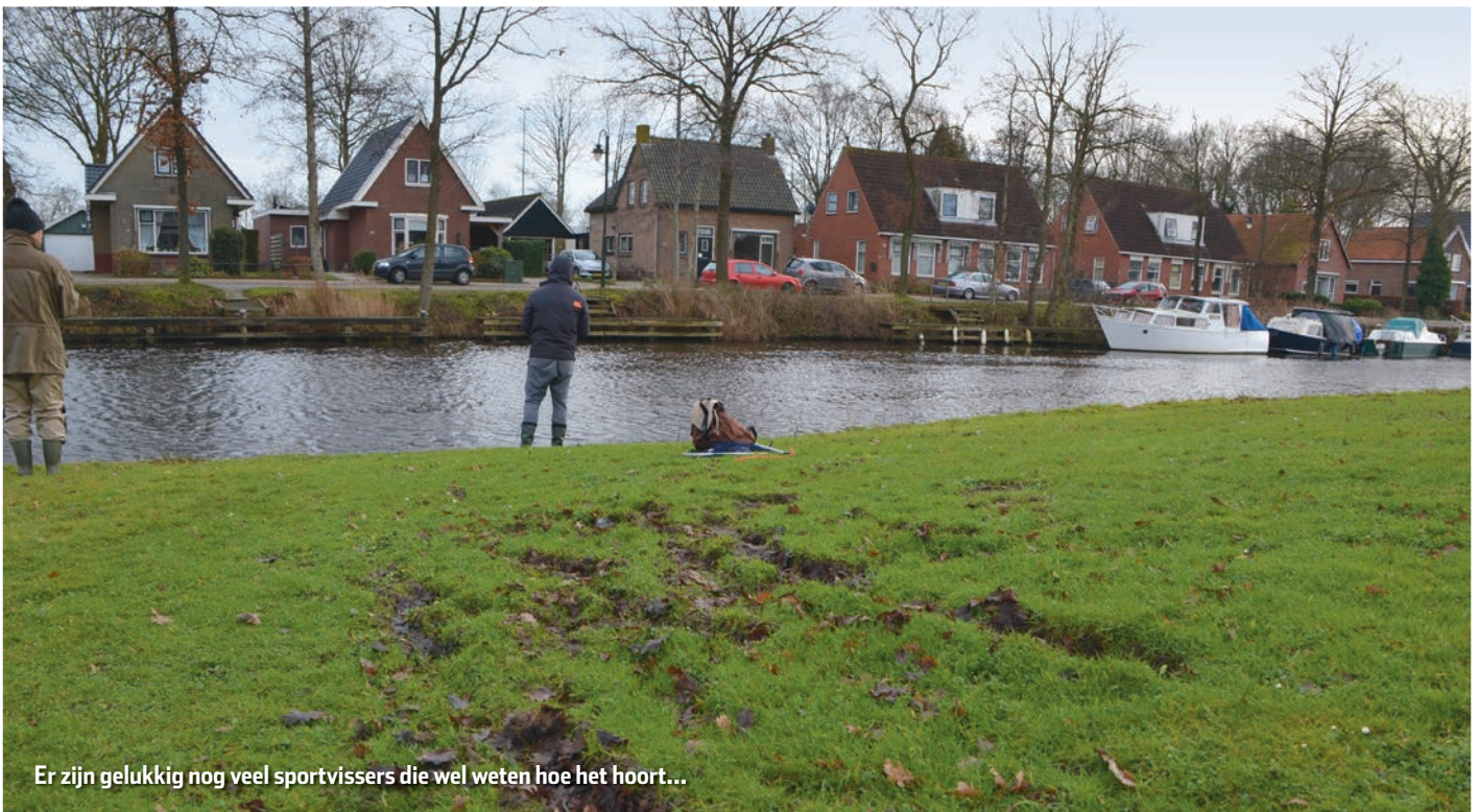
Er zijn gelukkig nog veel sportvissers die wel weten hoe het hoort...

Als we op alle gewenste stekken willen blijven vissen, of gebruik maken van voor sportvissers aangelegde voorzieningen, zullen alle sportvissers zich moeten gedragen alsof ze te gast zijn en rekening moeten houden met anderen. Door elkaar aan te spreken op (wan)gedrag kunnen we dat bereiken. Als je dan de vraag krijgt waarmee je je bemoeit, kun je gewoon melden dat je op dat moment de belangen van onze mooie sport aan het behartigen bent.