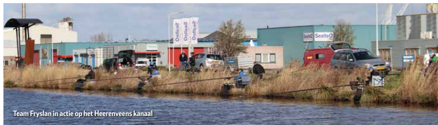
Team Fryslân in actie op het Heerenveens kanaal

Meld je dus aan voor de selectiedag op 8 november via visseninfriesland.nl/wedstrijden en misschien word jij wel geselecteerd voor Team Fryslân.