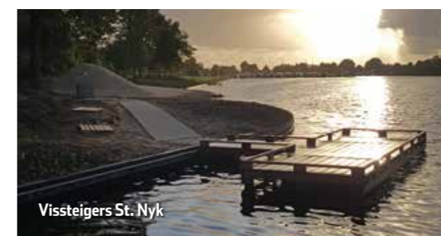
Vissteigers St. Nyk

Na ruim 6 jaar aan voorbereiding, vergaderen en tekenen zijn de werkzaamheden nu eindelijk van start gegaan en hebben wij in samenwerking met W.S.V. St. Nyk, plaatselijk belang Doniaga, de club van aanjagers van het Tjeukemeer en niet te vergeten Sportvisserij Fryslân een geweldig mooi recreatiegebied ontwikkeld.