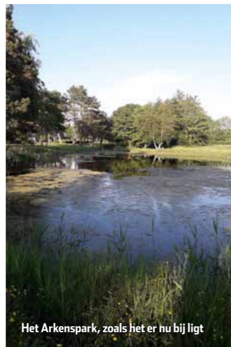
Het Arkenspark, zoals het er nu bij ligt

geschikt te maken voor de hengelsport. Zowel de Deinende Dobber als Sportvisserij Fryslân zien hier kansen om een visparel te realiseren. Indien de gemeente het water op de gewenste diepte brengt en er een onderhoudsschema wordt vastgesteld, kan er vis worden uitgezet en een (invaliden) vissteiger worden aangelegd. De wijkvereniging maakt graag gebruik van dit aanbod en heeft de gemeente hierover op de hoogte gesteld. Zodra de gemeente deze werkzaamheden heeft uitgevoerd en de voorzieningen zijn gerealiseerd beschikt de wijk over een goed toegankelijk viswater waar met name kinderen veilig kunnen (leren) vissen. Maar ook ouderen en mindervaliden krijgen een visplek in de nabije omgeving.