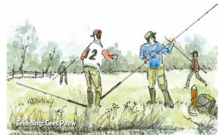
Tekening: Cees Pauw

Belangrijk bij de organisatie van activiteiten is om altijd het 'Algemeen protocol verantwoord sporten' van NOC*NSF na te volgen. De organisator