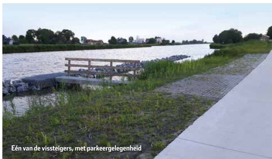
Eén van de vissteigers, met parkeergelegenheid