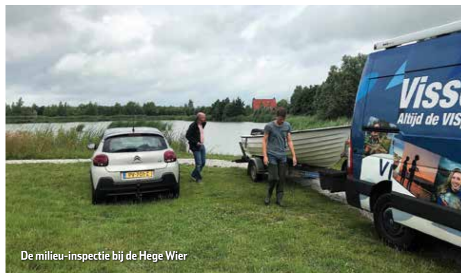
De milieu-inspectie bij de Hege Wier

Dit onderzoek bestaat uit twee gedeeltes, het eerste deel betreft de zogenaamde milieu-inspectie. Hierin wordt onderzoek gedaan naar de omstandigheden zoals waterdiepte, baggerlaag, begroeiing van de oever en de bodem, doorzichtigheid en ook de kwaliteit van het betreffende water. Het tweede gedeelte bestaat uit een inventarisatie van het visbestand. Begin juli heeft de milieu-inspectie in Berlikum en Wetzens plaats gevonden. Op de Hege Wier bleek dat er weinig waterplanten zijn, een harde bodem met zeer weinig bagger en een waterdiepte van 1,20 meter. Ook is de waterkwaliteit op verschillende dieptes getest op ondermeer zuurstofgehalten, elektrische geleidbaarheid (zoutgehalte) en pH-waarden. Hierna is de waterpartij in Wetzens bezocht en daar bleek een waterdiepte van gemiddeld 2 meter en een grote diversiteit aan waterplanten. Ruim 80% van dit water is begroeid met onderwater- en oppervlakteplanten en vervolgens is ook hier de waterkwaliteit getest. In het najaar wordt dit gevolgd door een inventarisatie van het visbestand. Op grond van de uitslagen van deze onderzoeken krijgen we een advies